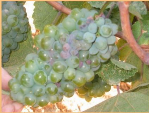
Síntomas en hoja y racimo